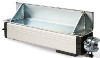
KT2010F 1 und.